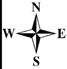
ЧЕРТЁЖ МЕЖЕВАНИЯ ТЕРРИТОРИИ