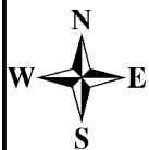
ЧЕРТЁЖ МЕЖЕВАНИЯ ТЕРРИТОРИИ. МАТЕРИАЛЫ ПО ОБОСНОВАНИЮ.